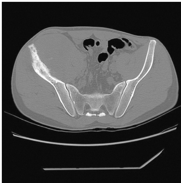
Figura 2. Tomografía computarizada ósea de pelvis que muestra una afección de la densidad del hueso ilíaco mixto, fundamentalmente escleroso que en su parte más inferior se acompaña de zonas líticas, con interrupción de la cortical; y una gran masa de partes blandas que contiene matriz tumoral mineralizada, asociada a la lesión ósea, con un diámetro de 8 cm que se extiende hacia la fosa ilíaca derecha e infiltra el músculo psoas-ilíaco.