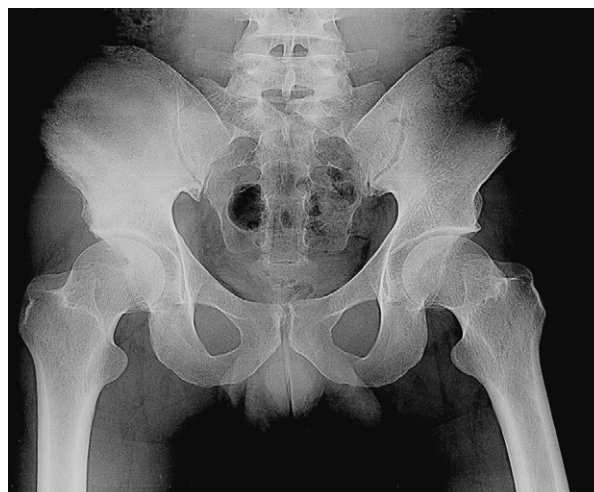
Figura 1. Radiografía de pelvis en la que se observa esclerosis y pequeñas áreas líticas que afectan a la cortical de la región ilíaca derecha.

El paciente aportaba una radiografía de pelvis (fig. 1) en la que se observaba una alteración del patrón óseo en la región ilíaca derecha, con esclerosis y pequeñas áreas líticas que afectaban a la cortical. Se realizó una tomografía computarizada (TC) ósea de pelvis (fig. 2), que mostró una afección de la densidad del hueso ilíaco mixto, fundamentalmente escleroso, que en su parte más inferior se acompañaba de zonas líticas, con interrupción de la cortical, y una masa en partes blandas, que contenía matriz tumoral mineralizada, asociada a la lesión ósea, con un diámetro de 8 cm que se extendía hacia la fosa ilíaca derecha e infiltraba el músculo psoas-ilíaco. Se completó el estudio con una gammagrafía ósea (fig. 3) en la que había un aumento de reacción os-