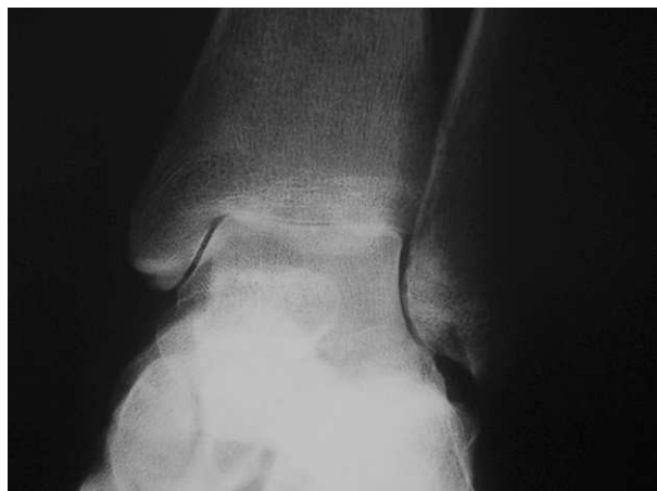
Figura 1. Radiografía de tobillo: deterioro erosivo tibioastragalino.

de Raynaud, 2 pérdidas fetales tardías, síndrome sicca, tumefacción parotídea bilateral intermitente, eritema malar, fotosensibilidad, alopecia, queilitis angular, anticuerpo anti-RNP positivo; nunca presentó deterioro articular o sistémico significativo. En el año 2002 se hallaron títulos de FAN 400 dils, moteado fino, LE positivo, anti-U1RNP, anti-Ro, anti-La positivos, Rose Ragan 128 dils, anti-ADN nativo negativo, anticardiolipinas IgG e IgM negativos, VDRL no reactivo, KPTT normal.