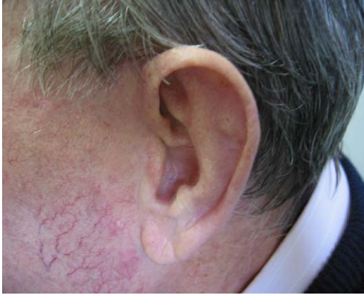
Figura 4. Imagen del pabellón auricular tomada en la primera revisión en consultas de Reumatología, tras 20 días de tratamiento corticoideo.

autoanticuerpos (ANA, ENA y ANCA) 1 negativos. Serologías (VHB, VHC, Lyme, Coxiella , Rickettsia , CMV, toxoplasma y parvovirus) y Mantoux negativos. La TAC de extensión fue normal. Debido al estreñimiento se solicitó colonoscopia, realizándose polipectomía de un pólipo aislado. El aspirado de médula ósea mostró un patrón de anemia de proceso crónico. Durante todo el ingreso el paciente mantuvo febrícula vespertina sin semiología infecciosa con hemocultivos seriados negativos. Lo más llamativo fue la aparición de eritema, dolor y tumefacción de ambos pabellones auriculares (fig. 1). Con la sospecha de policondritis se realiza biopsia auricular, llegando al diagnóstico (fig. 2 y 3) 2 .