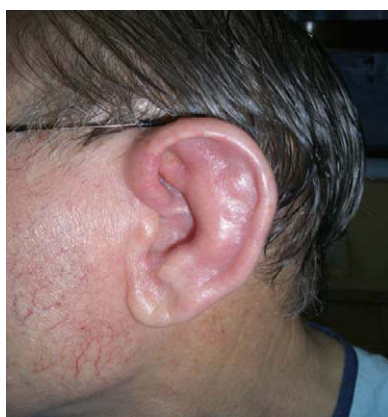
Figura 1. Pabellón auricular aumentado de tamaño, eritematoso y doloroso. Apareciendo en primer lugar el izquierdo y posteriormente el derecho.

Presentaba buen estado general, febrícula, sin adenopatías palpables en territorios periféricos. Auscultación cardíaca y pulmonar normal. Abdomen anodino. Máculas residuales hiperpigmentadas en extremidades. En la analítica completa destaca una VSG de 120 mm/h, PCR de 14,90 mg/dl y Hb de 9,6 g/dl con VCM de 90,9. Marcadores tumorales (CEA, CA 15,3, CA 19,9, PSA AFP, B2 microglobulina), hormonas tiroideas, factor reumatoide y