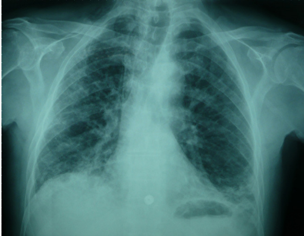
Figura 2. Radiografía posteroanterior de tórax. Se observa patrón intersticial bilateral más marcado en el hemitórax derecho.