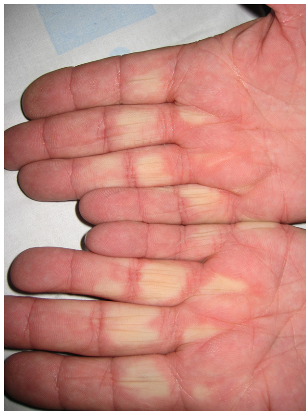
Figura 1. Fenómeno de Raynaud bifásico en ambas manos.

criptogenética (NOC) (fig. 3). Se recibieron los autoanticuerpos, que aclararon el diagnóstico: anticuerpos anti-Jo1 de 376 U/ml [N: 0-80], antinucleares 1/320, factor reumatoide 41,8 U/ml. Iniciamos tratamiento con metilprednisolona (1 mg/kg/día). El estudio electromiográfico fue normal y la espirometría manifestó