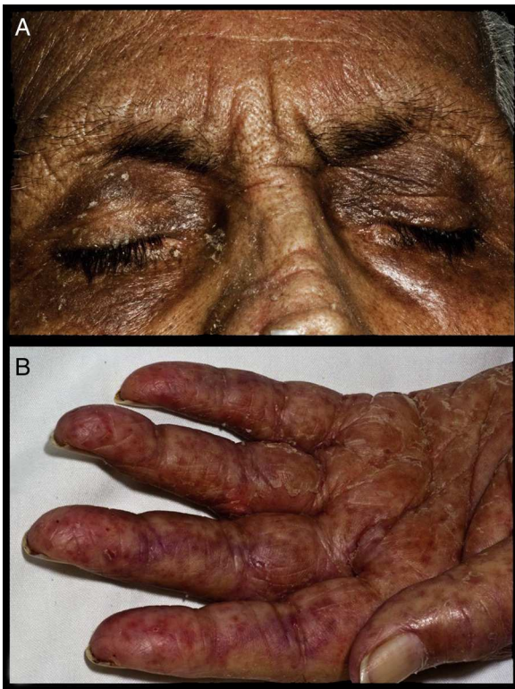
Figura 1. A) Eritema facial y en heliotropo. B) Dermatitis universal caracterizada por eritema y descamación (palma).