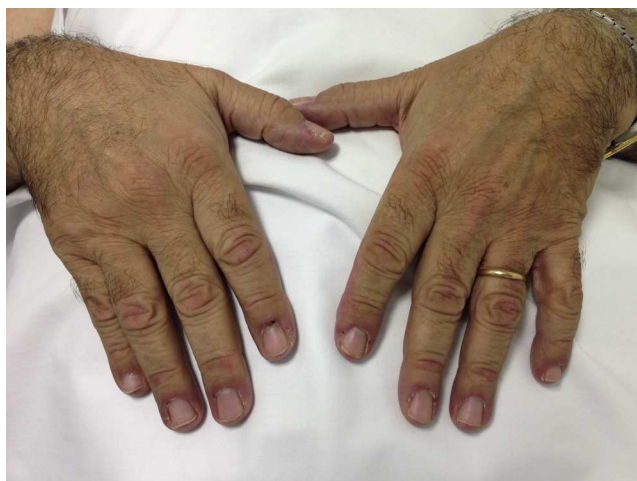
Figura 1. Pápulas de Gottron.

piridostigmina (60 mg/8 h). Fue remitido por la aparición de debilidad muscular desde hacía un mes, con dificultad para vestirse o levantarse de la cama, artralgias en hombros y elevación de creatinina (CK). Presentaba eritema facial difuso desde hacía 6 meses. La exploración física mostró engrosamiento cuticular con hemorragias, pápulas de Gottron (fig. 1) y eritema facial, en chal y en escote (fig. 2). Presentaba debilidad de la musculatura proximal en miembros superiores e inferiores (4/5). El resto de la exploración general fue normal.