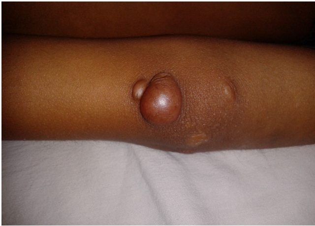
Figura 1. Xantoma tuberoso en codo.

El término esteroides de plantas lo constituyen los fitoesteroides y los fitoestanoles. Los fitoesteroides están relacionados de manera cercana con el colesterol, difiriendo principalmente en la configuración de la cadena lateral. Los fitoesteroides más comunes son el sitosterol, campesterol y estigmasterol. Los humanos no pueden sintetizar fitoesteroides, por lo que su única fuente proviene de la dieta. Usualmente menos del 5% de los fitoesteroides de la dieta son absorbidos, comparados con el 55% del colesterol. El hígado rápida y preferentemente excreta los fitoesteroides por la bilis. Esto lleva a una baja retención de esteroides no-colesterol. En 1998 Patel encontró el locus de la sitosterolemia, STSL , en el cromosoma 2p21. Este locus compromete 2 genes adyacentes ABCG5 y ABCG8 , que codifican 2 transportadores intestinales de esteroides, esterolina-1 y esterolina-2. Las mutaciones en cualquiera de estos, lleva a desarrollar sitosterolemia. Estos transportadores se encuentran en la membrana apical del enterocito y en el tracto biliar. ABCG5 y ABCG8 regulan la red de absorción y excreción de fitoesteroides y colesterol. En el enterocito promueven el flujo de fitoesteroides de vuelta a la luz intestinal, en el hígado promueve la excreción de esteroides en la bilis 4,6,7,9,10 .