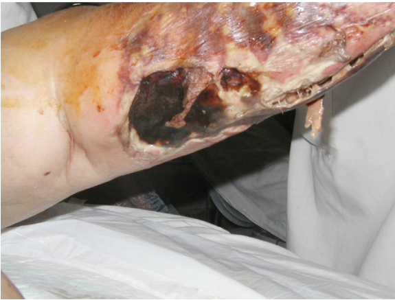
Figura 1. Escara necrótica en pierna izquierda.

vascular y trombosis de la luz endovascular, hallazgos compatibles con calcifilaxis (fig. 2). Los cultivos de la biopsia descartaron la presencia de hongos, micobacterias y otros gérmenes.