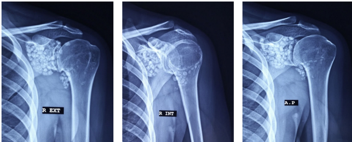
Figura 1. Las radiografías de hombro en posiciones AP verdadera, rotación externa y rotación interna demuestran la presencia de múltiples cuerpos calcificados de tamaño uniforme, distribuidas en toda la articulación glenohumeral izquierda, así como en el receso subescapular y el canal del tendón bicipital.

Paciente femenino de 29 años, con cuadro de dolor en el hombro derecho de 4 años de evolución, con limitación de abducción vertical y evolución tórpida. Pevio a su estudio se agrega dolor en la región anterior del hombro. Se realizan estudios de imagen (figs. 1 y 2), diagnosticándose osteocondromatosis sinovial.