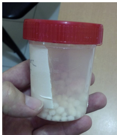
Figura 3. Obtención de los cuerpos condrales posterior a la resección quirúrgica con técnica abierta. El resultado del estudio histopatológico fue de condromatosis sinovial.

Mediante resección quirúrgica artroscópica, se obtuvieron fragmentos condrales, enviados al servicio de anatomía patológica, reportando como diagnóstico histopatológico condromatosis sinovial (fig. 3). Posterior a la cirugía la paciente presentó buena evolución, con desaparición del dolor.