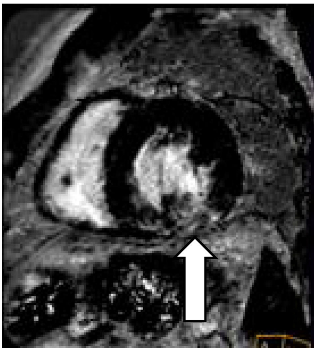
Figura 1. CRM que muestra afectación parcheada intramiocárdica (la flecha indica una de las zonas miocárdicas más afectadas).

Se cursa una muestra de gota seca ( blood-spot ) que descarta enfermedad de Fabry, y se realiza nueva PAAF ganglionar, por ecobroncoscopia, que muestra material hemático y linfocitos sin atipias ni granulomas. Las baciloscopias y el cultivo para micobacterias fueron negativos. Una coronariografía no objetiva lesiones angiográficas significativas. Una gammagrafía con galio muestra captación en la región mediastínica alta anterior derecha e