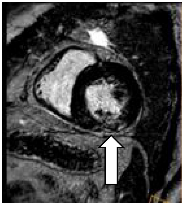
Figura 2. CRM que muestra disminución de la afectación parcheada intramiocárdica tras tratamiento inmunosupresor (la flecha indica la zona de afectación miocárdica que se ha reducido respecto a la CRM previa).