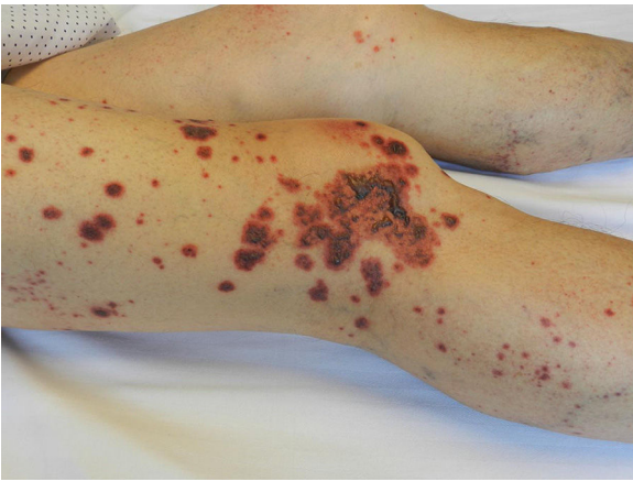
Figura 1. Imagen clínica del paciente que presentaba púrpura palpable en extremidades inferiores con formación de ampollas hemorrágicas.

pulsos de metilprednisolona (125 mg intravenoso) con posterior dosis de prednisona 15 mg/día en pauta descendente suspendiendo la corticoterapia en el plazo de 2 meses.