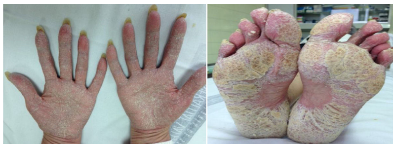
Figura 1. Imágenes de psoriasis palmo-plantar en un paciente en tratamiento con anti-TNF.

La pustulosis palmo-plantar y la psoriasis en placas, al igual que en la mayoría de series, es la principal morfología de las lesiones que observamos en nuestro trabajo 6 . La biopsia cutánea puede ayudar a confirmar el diagnóstico de psoriasis y a diferenciarlo de otras entidades 7 . De hecho, en nuestra serie observamos un caso de pitiriasis liquenoide confirmado histológicamente. Está descrito que hasta el 15% de pacientes pueden presentar más de un tipo de lesión 6 , y coincidiendo con nuestros datos, la mayoría de pacientes