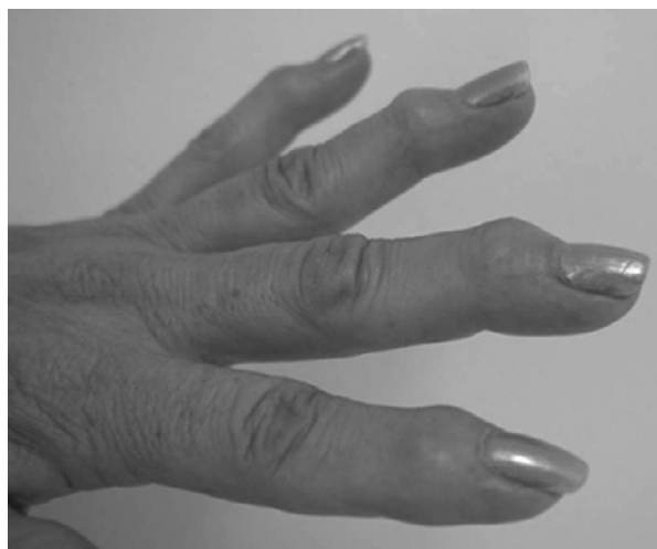
Figura 1. Paciente con osteoartritis de manos, donde se observan los cambios en las articulaciones interfalángicas distales (nódulos de Heberden).

Estudios recientes han demostrado el impacto que tiene la OA en diferentes poblaciones. Mannoni et al 3 demostraron en un estudio realizado en Italia que un 29% de los pacientes de su población padecía OA de rodilla, a la que seguían la OA de mano (14%) y la de cadera (7%). Los pacientes con OA de cadera tenían una reducción significativa de la calidad de vida en comparación con los que tenían afección de rodilla y/o mano. Zangh et al 4 demostraron que las mujeres tenían hasta un 26% de OA en la mano, frente al 13% de los varones, en la cohorte de Framingham. Los síntomas bilaterales se observaron en un 16% de las mujeres y un 7% de los varones. Las articulaciones con mayor afección radiológica fueron las interfalángicas distales. La OA en manos causó discapacidad funcional en actividades de la vida diaria como cargar bultos, agarrar pequeños objetos y escribir (fig. 2). Actualmente hay estudios donde se demuestran diferencias en la prevalencia entre diversas poblaciones. Nevitt et al 5 demostraron una baja prevalencia de OA de cadera en una población china comparada con una población similar de Estados Unidos. Felson et al 6 comunicaron un