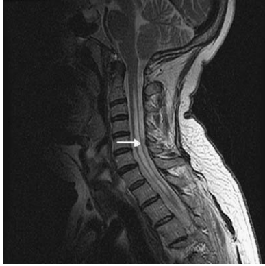
Figura 3. Resonancia magnética cervical en plano sagital T2. Muestra la existencia de una cavidad quística centromedular moderadamente dilatada compatible con hidrosiringomielia (como indica la flecha) y un descenso de las amígdalas cerebelosas con morfología en pico por malformación de Chiari tipo I.