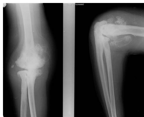
Figura 1. Radiografía anteroposterior y lateral de codo derecho. Se observa destrucción articular con erosiones a nivel del húmero, importantes cambios esclerosos periarticulares, osteocondromatosis evolucionada y pinzamiento articular.

Ante la presencia de una artropatía destructiva del codo, sin antecedente de infección previa, sospechamos de la presencia de una artropatía neuropática. Por ese motivo, se realizó una RM cervical (fig. 3) que mostró una cavidad quística centromedular compatible con siringomielia y una malformación de Chiari tipo I. El diagnóstico fue de artropatía neuropática por siringomielia. Se intervino a la paciente con colocación de prótesis total del codo y liberación del nervio cubital, con buena evolución después de 4 años (fig. 4). Respecto al tratamiento para la siringomielia, se decidió una actitud conservadora.