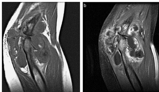
Figura 2. Resonancia magnética de codo derecho en plano sagital T1 (a) y con gadolinio (b). Se observa marcada desestructuración articular con destrucción osteocondral, irregularidades óseas, quistes y osteofitosis. Distensión de la cápsula articular por derrame sinovial y osteocondromatosis muy evolucionada.