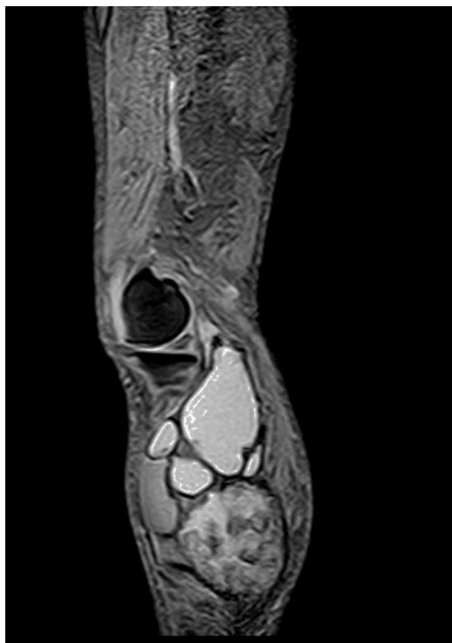
Figura 4. RM. Imagen STIR sagital. El hematoma muestra aumento difuso de la intensidad de la señal.

Los autores declaran no tener ningún conflicto de intereses.