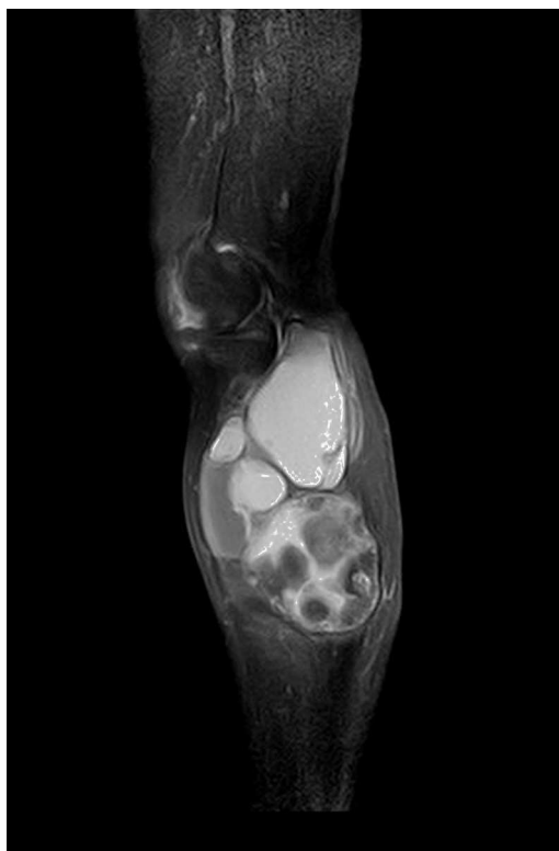
Figura 5. RM. Imagen sagital en T1 con saturación grasa. Se observa potenciación periférica pero comparado con la imagen precontraste no existe potenciación central significativa, lo que indica su naturaleza quística.