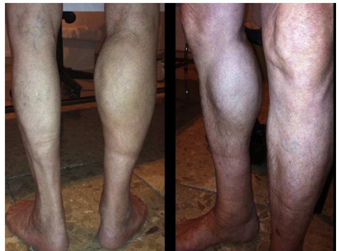
Figura 1. Asimetría gemelar.

El quiste de Baker complicado es una entidad muy habitual. La prevalencia se incrementa con la edad. Sin embargo, solo hemos