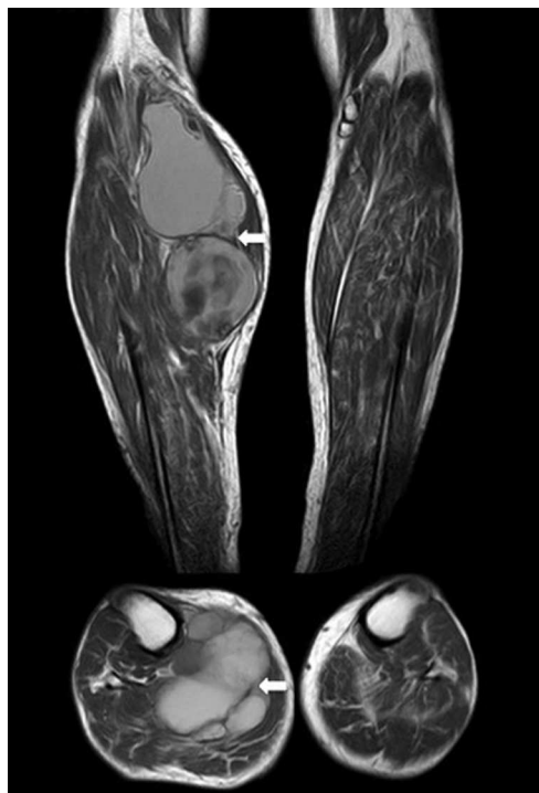
Figura 3. RM. Imágenes axial y coronal en T1. Masa bien circunscrita (flechas). Aumento de la intensidad de señal compatible con presencia subaguda de productos sanguíneos.