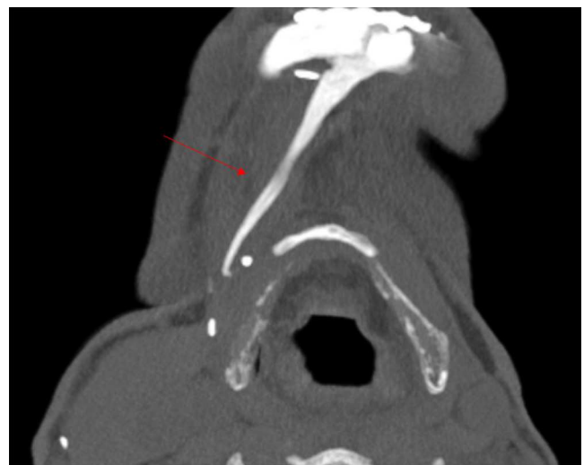
Figura 1. Proyección axial maximum intensity projection (MIP): muestra la calcificación lineal anormal.

mitad de los pacientes presentan una historia de múltiples lesiones o traumatismos en el área afectada 1,2 . Un caso similar de miositis osificante en los músculos faciales está descrito en la literatura 3 . La radioterapia, la cirugía y la inmovilización prolongada del maxilar inferior son factores que pueden tener un papel en el desarrollo de miositis osificante en estos casos.