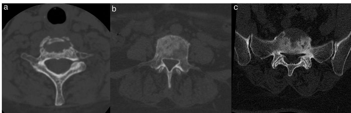
Figura 2. Tomografía computarizada. Lesiones líticas y esclerosas en cuerpos vertebrales de columna cervical (a), dorsal (b) y lumbosacra (c).

Se realizaron una punción-aspiración con aguja fina y biopsia ósea vertebral (L3-L4) guiada por TC que mostraron tejido óseo y