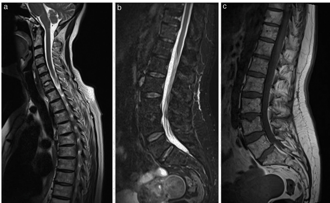
Figura 4. Sagital T2 cervicodorsal (a) que muestra una señal del hueso medular difusamente heterogénea, sin áreas focales de señal destacables en los cuerpos afectados en control anterior. Persiste hundimiento focal del platillo vertebral superior de C7. Sagital STIR dorsolumbar (b), que muestra señal del hueso medular homogéneamente suprimida sin las áreas de patrón de edema descritas en control anterior. Sagital T1 dorsolumbar (c) que muestra señal del hueso medular difusamente heterogénea con patrón de hiperintensidad T1 predominante, compatible con predominio de médula ósea grasa en todos los cuerpos vertebrales. Persiste el hundimiento focal/hernia intraesponjosa en platillo superior de L4 de aspecto crónico.

Se orientó como una osteítis vertebral múltiple no infecciosa asociada a pustulosis (SAPHO). Ante la falta de control clínico con tratamiento antiinflamatorio (naproxeno, indometacina), se inició infliximab por vía intravenosa (5 mg/kg en las semanas 0, 2, 4 y después cada 8 semanas).