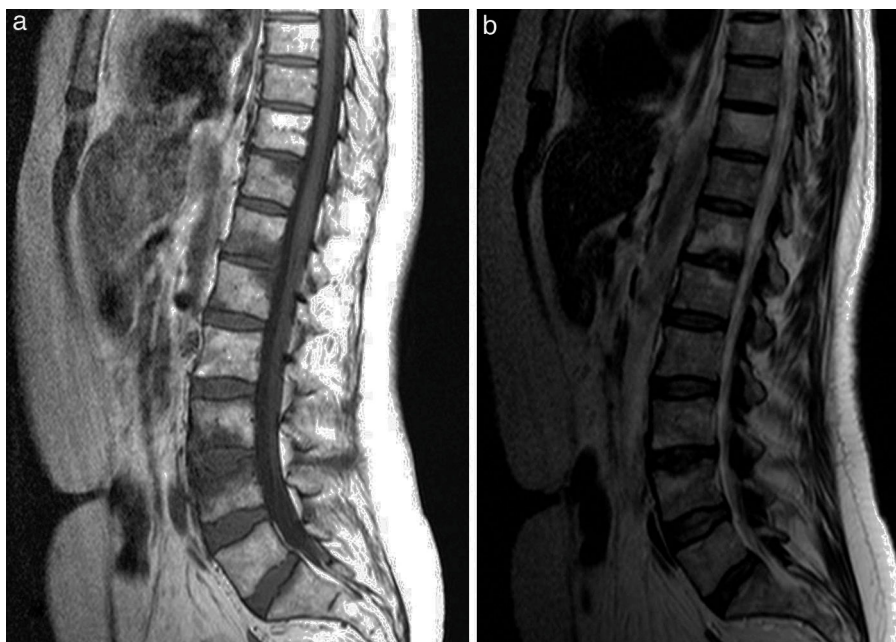
Figura 3. Sagital T1 dorsolumbar (a). Alteración de la señal focal del hueso medular, en relación con platillos vertebrales superior de D11, platillos D12/L1 y L3/4. En la afectación L3/4 se asocia hundimiento del platillo vertebral superior con márgenes irregulares. Sagital T2 dorsolumbar (b), que demuestra hiperintensidad T2 correspondiente con las áreas de alteración de la señal T1, compatible con patrón de sustitución del hueso medular normal por edema reactivo/inflamatorio dada la relación con superficies articulares.

hematopoyético con presencia de células plasmáticas, sin evidencia de células malignas.