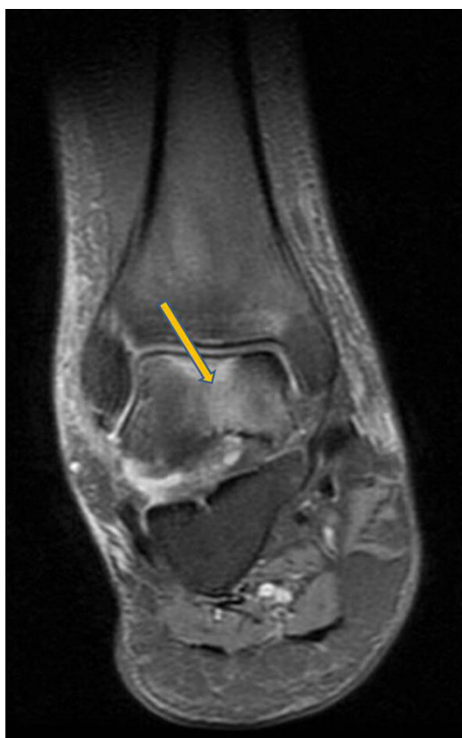
Figura 2. Imagen de la resonancia magnética al 7.º mes. Tobillo derecho. Afectación de astrágalo.

No obstante, la algodistrofia de Südeck, la distrofia simpática refleja, el síndrome de dolor regional complejo, el síndrome de edema medular óseo, la osteoporosis transitoria (regional o migratoria) y la necrosis avascular tienen sintomatología similar, son idiopáticas y presentan edema medular óseo en la RMN, por esto pueden formar parte o ser diferentes estadios de la misma enfermedad, incluido bajo el término general de síndrome de edema medular óseo 3 .