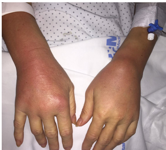
Figura 1. Artritis de ambos carpos con tenosinovitis.

eritema, calor y limitación funcional) de ambos carpos (fig. 1), segunda articulación metatarsofalángica izquierda y articulación esternoclavicular izquierda. No rash, adenopatías, úlceras orales y/o genitales, ni lesiones cutáneas. Resto de la exploración normal.