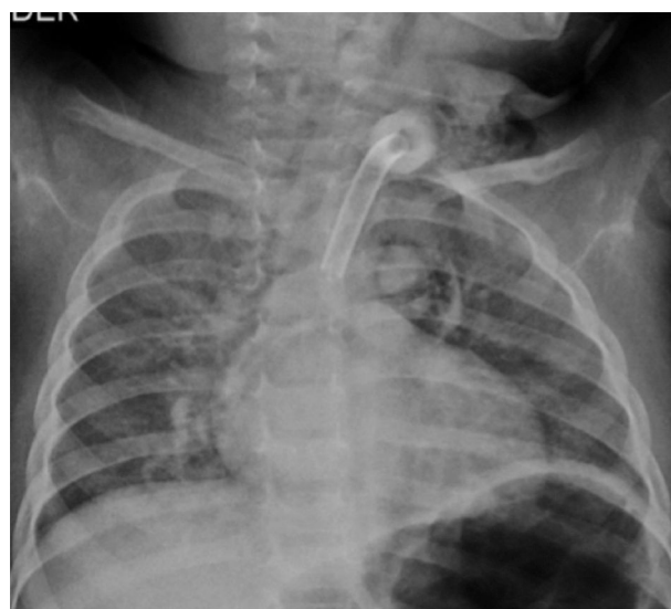
Figura 1. Placa simple de tórax con evidencia de infiltrado parahiliar bilateral difuso micronodular.

Metotrexate a 15 mg/m 2 /sc semana. No utilizando esteroides debido a la refractariedad presentada desde el inicio de la sintomatología. Se ofrece seguimiento tomando control de broncoscopia sin evidencia de granulomas reactantes negativos. Continúa con manejo con metotrexate a 15 mg/m 2 /sc semana y ácido fólico 5 mg/24 h de lunes a jueves.