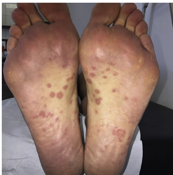
Figura 1. Placas asalmonadas en las plantas de ambos pies.