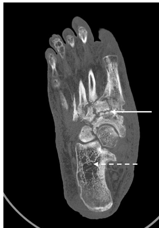
Figura 1. Tomografía computarizada del pie derecho: flecha blanca recta: afectación difusa con desestructuración y remodelación ósea del mesopié tarso-metatarsiana y escafo-cuneiformes. Flecha blanca punteada: áreas radiolúcidas compatibles con osteopenia por desuso.

en el momento del diagnóstico. El tratamiento inicial —como es el caso que presentamos—, además del antibiótico ajustado —en caso de infección asociada— y las curas de enfermería, consiste en la inmovilización y descarga del pie mediante yeso completo, para minimizar el edema y detener la progresión de la enfermedad. En una segunda fase, se utilizan los calzados hechos a medida 3,4 . Si fracasa, en los pies con deformidad severa, se puede practicar una cirugía —para lograr un pie plantígrado y evitar que las exostosis provoquen presión en la piel y por lo tanto úlceras, una cirugía de tendones para restaurar el equilibrio muscular o la reconstrucción electiva para dejar un pie funcional y prevenir la amputación— 3,4 , que, en nuestro caso, ha sido rechazada por el propio paciente.