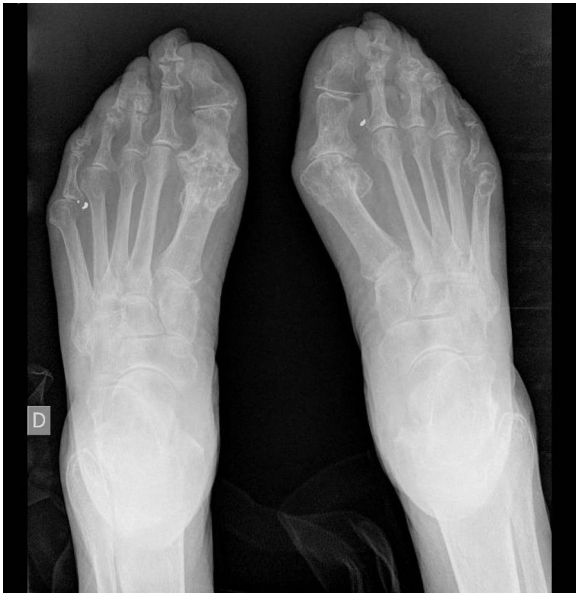
Figura 3. Radiografía de pies: erosiones en primeras metatarsofalángicas.