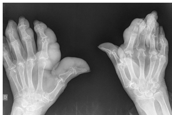
Figura 2. Radiografía de manos: aumento de partes blandas y erosiones.