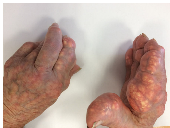
Figura 1. Depósitos tofáceos en manos.

Se realizan radiografías óseas en las que se observa importante aumento de partes blandas, pinzamientos y erosiones en metacarpofalángicas, interfalángicas proximales e interfalángicas distales de ambas manos (fig. 2), así como erosiones en primeros metatarsianos y luxación del 5.º metatarsiano izquierdo (fig. 3).