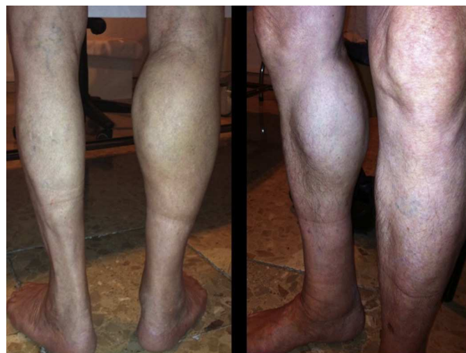
Figura 1. Asimetría gemelar.

El quiste de Baker complicado es una entidad muy habitual. La prevalencia se incrementa con la edad. Sin embargo, solo hemos