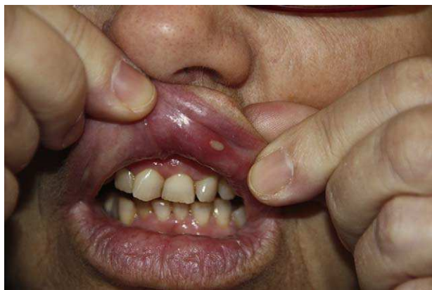
Figura 1. Las lesiones se inician mediante un foco inflamatorio en forma de máculas eritematosas dolorosa.

blando. Se presenta en forma de úlceras únicas o poco numerosas (menos de 5) de un tamaño igual o superior a 1 cm. Habitualmente tienen predilección por la parte posterior de la boca. Son más profundas y dolorosas que las aftas minor . Tardan de 2 a 12 semanas en curar y dejan una cicatriz.