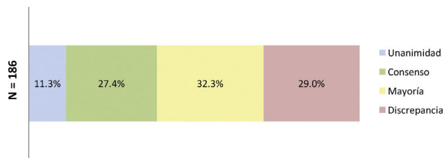
Figura 1. Porcentajes obtenidos tras finalizar la primera ronda de consulta. La figura 1 muestra los porcentajes obtenidos en términos de unanimidad, consenso, mayoría y discrepancia una vez finalizada la primera ronda del Delphi. N = número total de desenlaces consultados en la primera ronda.