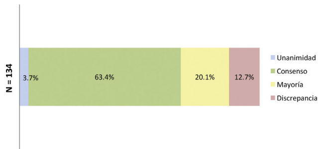
Figura 2. Porcentajes obtenidos tras finalizar la segunda ronda de consulta. La figura 2 muestra los porcentajes obtenidos en términos de unanimidad, consenso, mayoría y discrepancia al final del estudio. N = número total de desenlaces consultados en la segunda ronda.