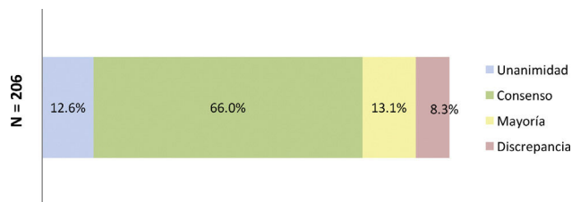
Figura 3. Porcentajes obtenidos tras las dos rondas de consulta. La figura 3 muestra los porcentajes obtenidos en términos de unanimidad, consenso, mayoría y discrepancia al final del estudio. N = número total de desenlaces consultados al final del estudio.