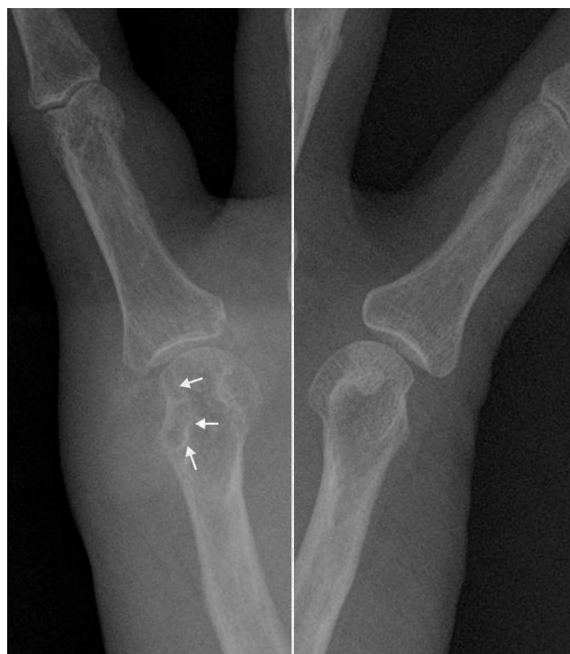
Figura 2. Radiografías centradas en la quinta articulación metacarpofalángica de ambas manos que permite valorar comparativamente la erosión ósea de margen escleroso (flechas) con el aumento de las partes blandas, de alta densidad, en la vertiente medial de la cabeza del metacarpiano derecho. No hay afectación del espacio articular.

Al inicio de los síntomas, la paciente se presentó en la consulta de su médico de cabecera, que le pautó antibióticos, pero al no notar mejoría, acudió al Servicio de Urgencias. En el interrogatorio, no refirió enfermedades conocidas, ni antecedentes traumáticos; tampoco tenía sensación distérmica, ni se registró fiebre. Ante la ausencia de antecedentes y al tratarse de una afectación monoarticular, el médico de urgencias se planteó descartar un origen